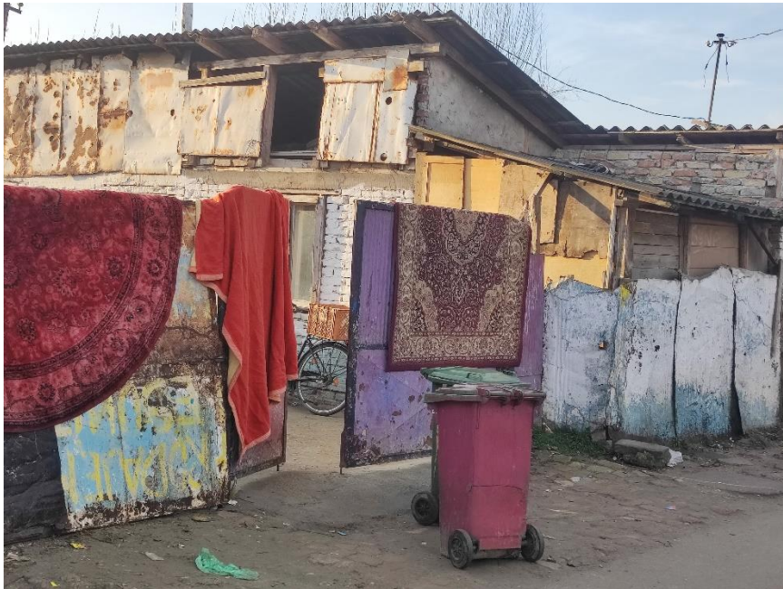
Fotografija 1: Kuća u naselju Veliki rit (gde stanuje većina povratnika u ovom istraživanju)

Kao što je konstatovano u više dokumenata koji se bave društvenim položajem Roma, ne postoji pouzdana evidencija o veličini ove etničke zajednice u Srbiji. Popisni podaci iz 2011. ukazuju na brojku od 147.604 Roma, ali su nezvanične statističke procene da bi taj broj mogao biti preko 250.000 (Radoman, Tadić, 2014). Razlog zbog kojeg je ovaj broj teško proceniti je ujedno i prvi pokazatelj, prva dimenzija socijalne isključenosti Roma: veliki broj njih nije registrovan ni u vitalnoj statistici, niti u administrativnoj evidenciji. Buduci da nemaju građanski status i lična dokumenta, mnogi Romi ne mogu da ostvare ni elementarna ljudska prava koja bi trebala da im pripadaju (UND, RIC, 2007).