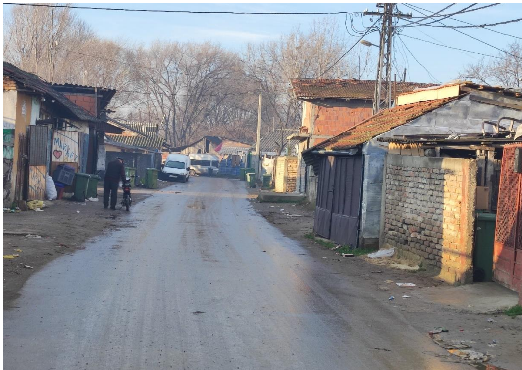
Fotografija 3: Ulaz u Naselje Veliki rit