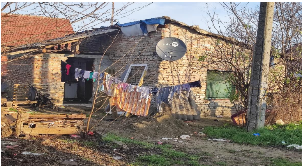
Fotografija 2: Kuća u naselju Veliki rit

Hronično siromaštvo, poseban kulturni i društveni model, visoka stopa nezaposlenosti, stereotipi i diskriminacija, niska stopa obrazovanja i zabrinjavajuće stanje u zdravstvenoj zaštiti Roma su problemi koji su učinili da u ovom delu Evrope romska zajednica bude »vidljiv problem« i da je potrebno da se na regionalnom nivou unapredi društveni položaj Roma. Taj proces pokrenuli su Fond za otvoreno društvo, Svetska banka i Evropska zajednica tražeći od vlada zemalja centralne i jugoistočne Evrope da svojim strategijama i akcionim planovima za Rome značajno unaprede društveni položaj Roma i integrišu ih u sve društvene, ekonomske i političke tokove u svojim zemljama. Taj proces, poznat kao Dekada inkluzije Roma, započeo je potpisivanjem zajedničke Deklaracije država: Češke, Slovačke, Mađarske, Rumunije, Bugarske, Hrvatske, Makedonije, Srbije i Crne Gore u Sofiji, 2005. godine.